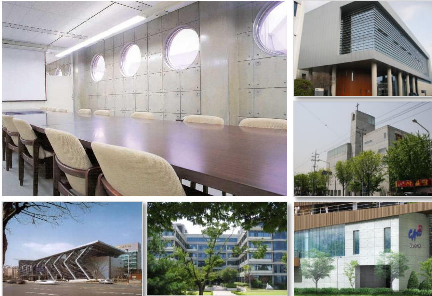
[고광택 노출콘크리트 적용 사례]

- Transition zone 이란 시멘트 수화반응시 이물질과 경계면에서 발생하는 특수 화학반응 영역을 말한다.