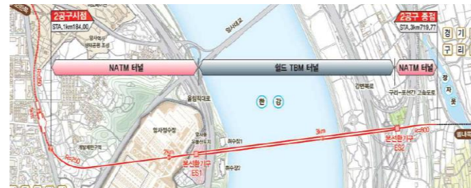
[당사 실드공법 현장 적용 사례]